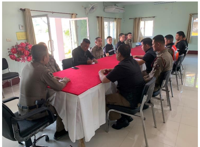
ประชุมมอบหมายคณะทำงานและผู้รับผิดชอบการยกระดับการเผยแพร่ข้อมูลสาธารณะ (OIT)